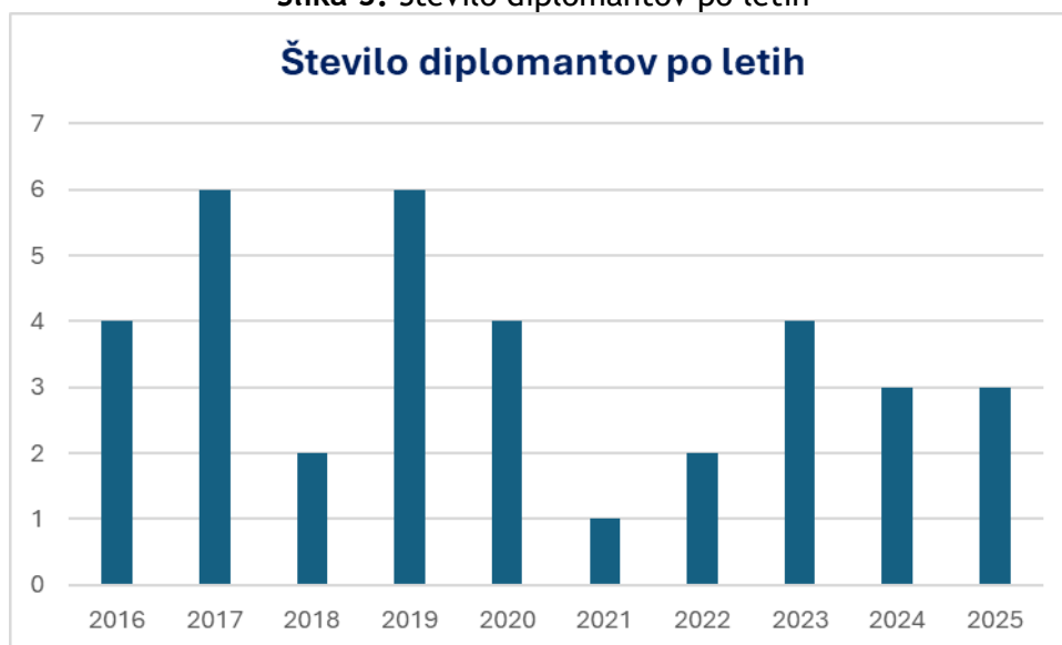
Slika 3: Število diplomantov po letih