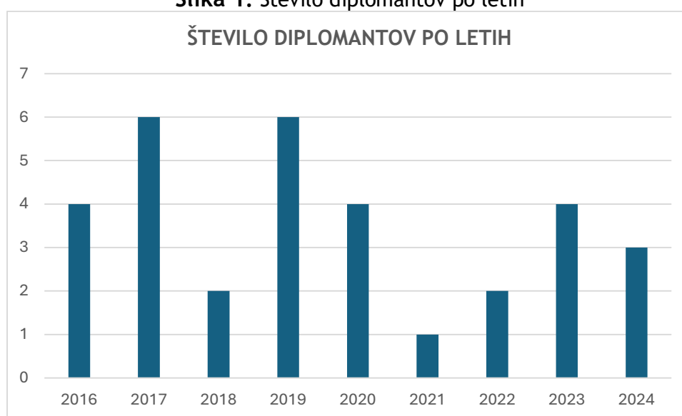
Slika 1: Število diplomantov po letih