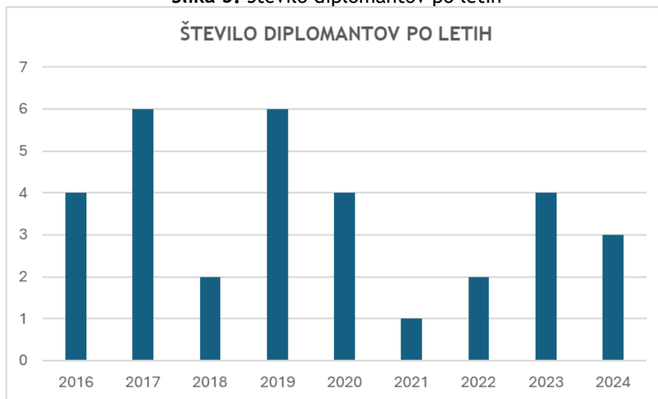
Slika 3: Število diplomantov po letih