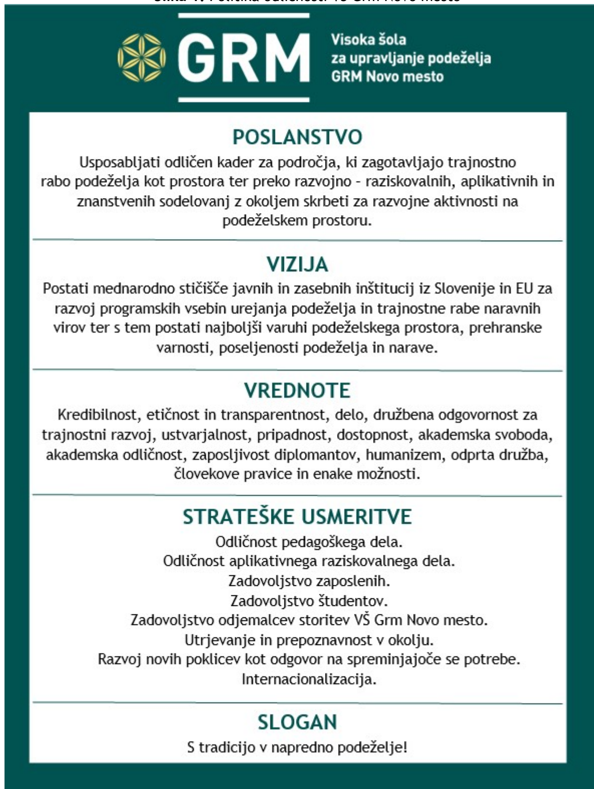
Slika 1: Politika odličnosti VŠ Grm Novo mesto