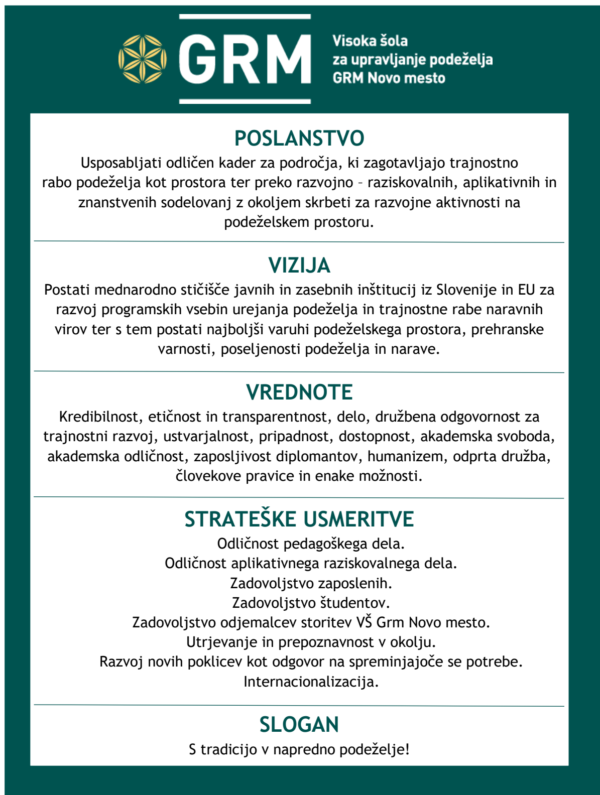
Slika 2: Politika odličnosti VŠ Grm Novo mesto