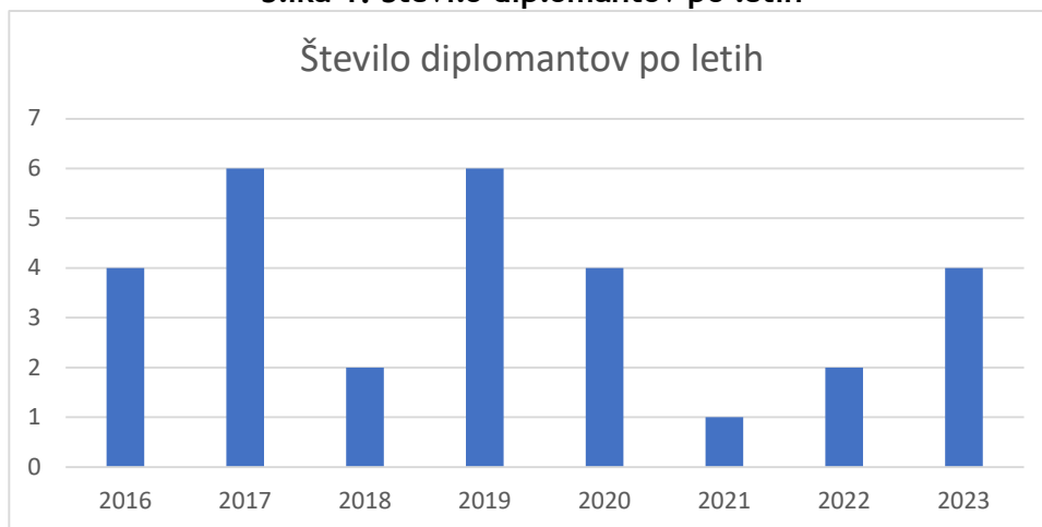
Slika 1: Število diplomantov po letih